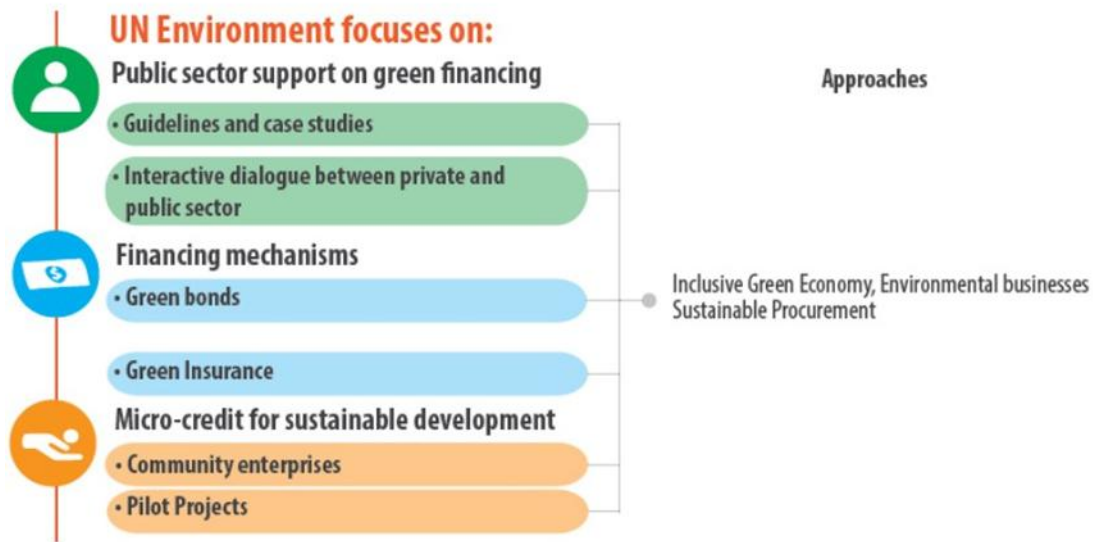
Sustainable Development Goals (SDGs) and Green Financing

Inoltre, i finanziamenti verdi potrebbero aumentare i partenariati tra governi, imprese e cittadini, includendo i principali attori come i mercati finanziari, le banche, gli investitori, gli enti di microcredito, le compagnie di assicurazione e il settore pubblico.